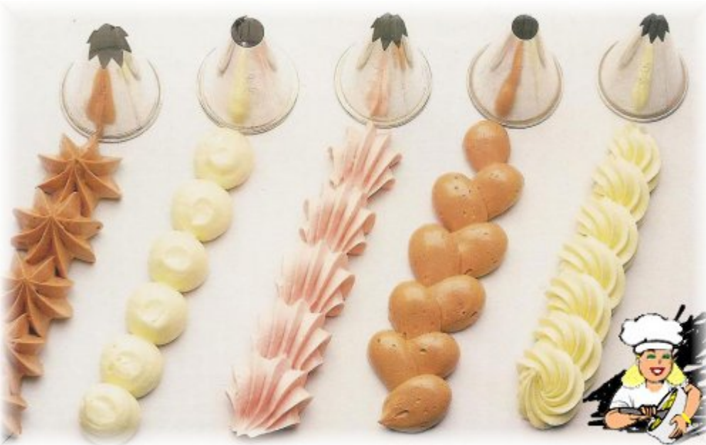
Çeşitli duylarla yapılmış süslemeler